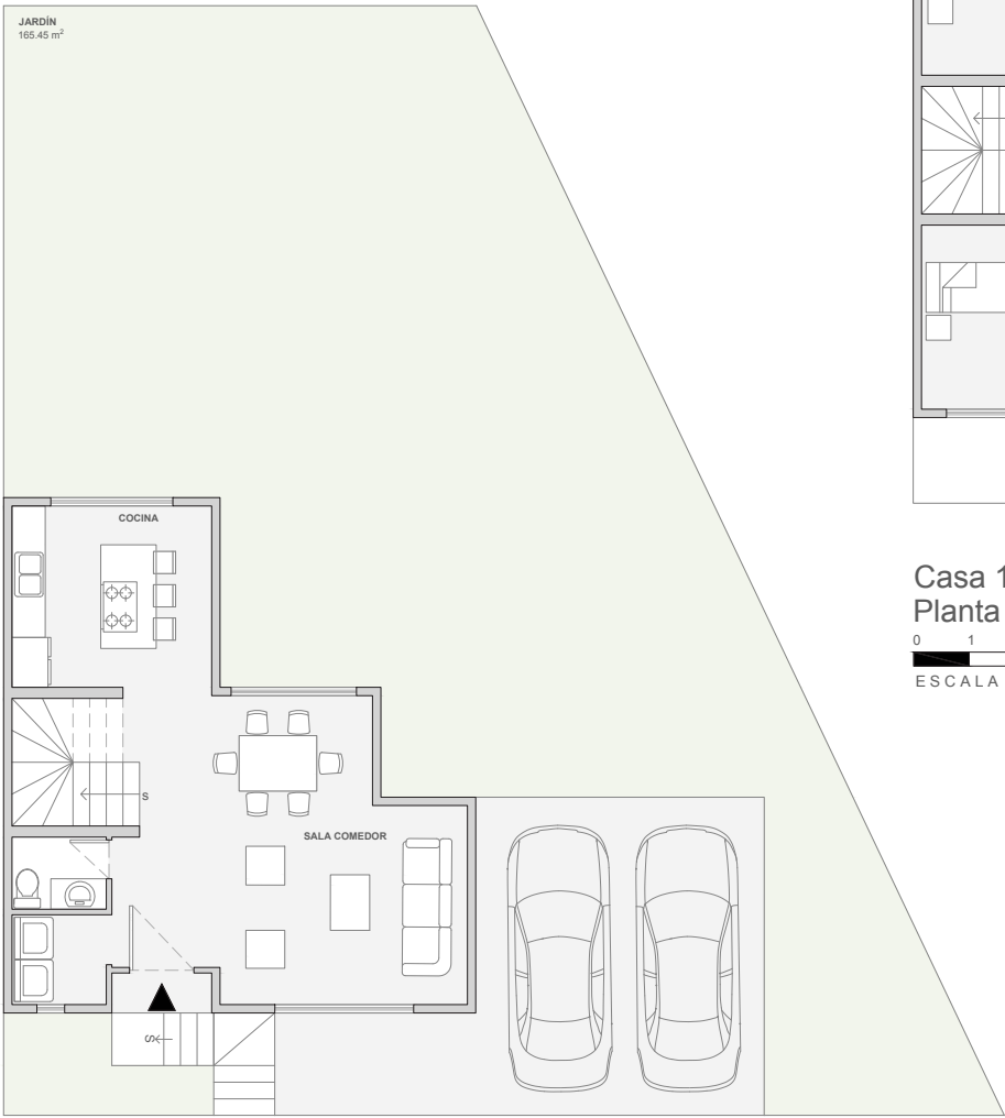
Casa 109 Planta Baja ESCALA 1:125